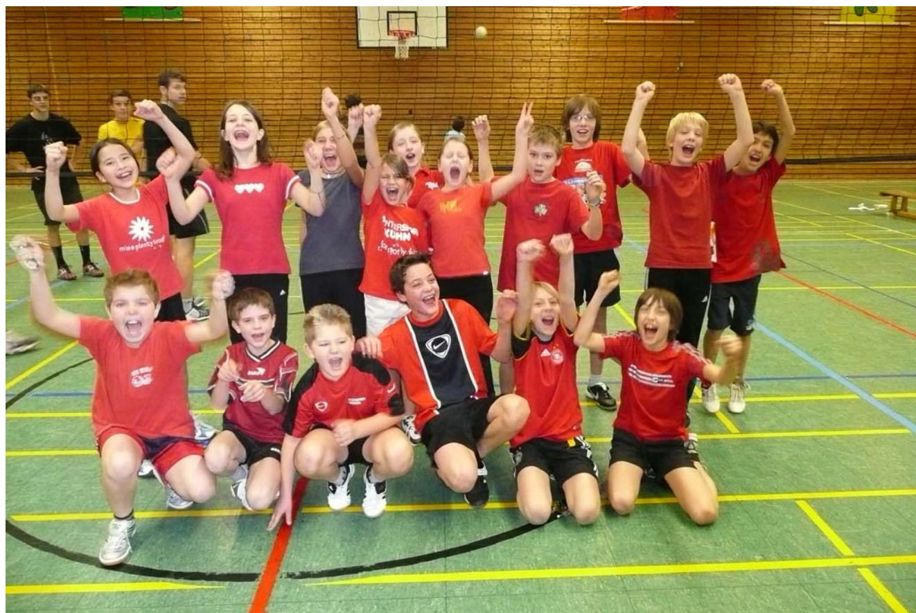
Die Klasse 5c beim Volleyballturnier am 20.12.07