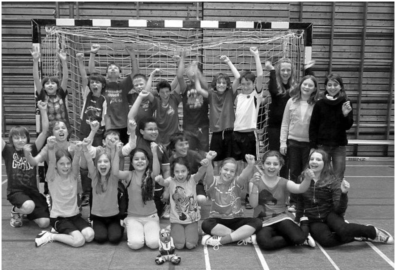
Klasse 5e: die glücklichen Sieger beim Steinmännle-Pokal am 14.05.10

Zeller Straße 33 77654 Offenburg Tel. 0781 9377-0 Fax: 0781 9377-28 E-Mail: sekretariat@schiller-offenburg.de Homepage: www.schiller-offenburg.de