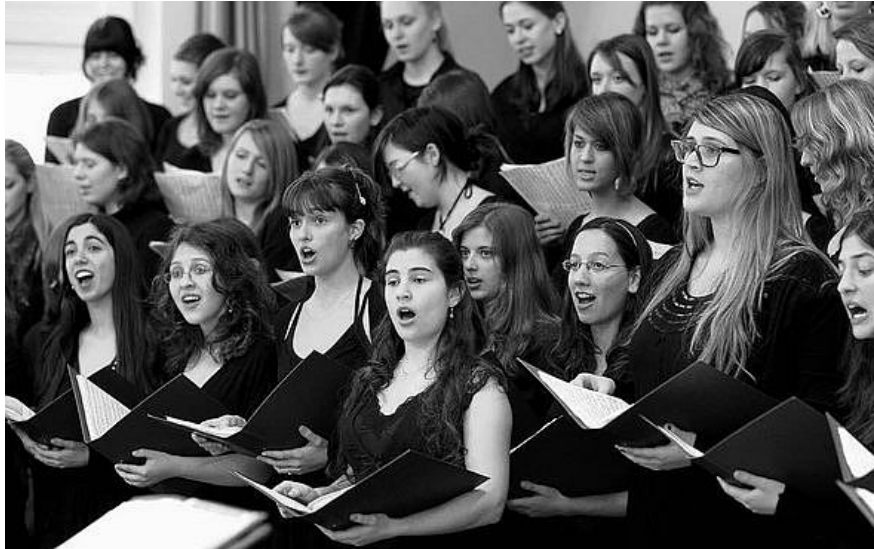
Gemeinsames Konzert mit dem Thelma Yellin Chor am 28.02.2010