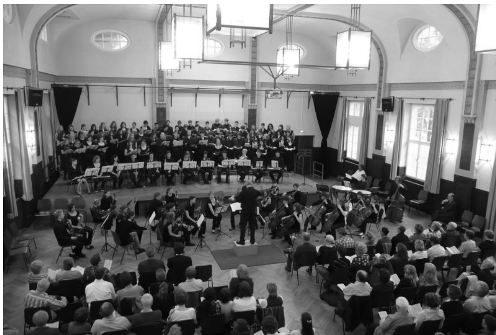
ein Höhepunkt des Schuljahres: Rombergs „Glocke“ am 13.05.09